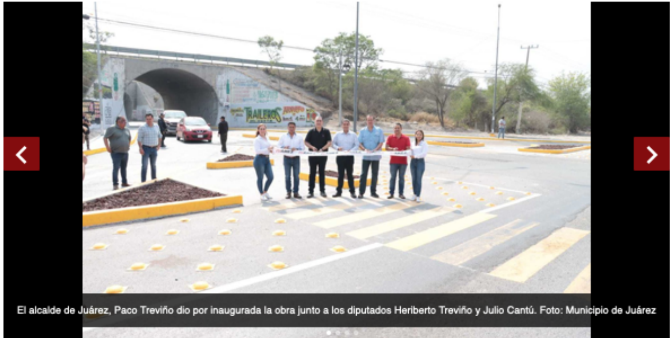
El alcalde de Juárez, Paco Treviño dio por inaugurada la obra junto a los diputados Heriberto Treviño y Julio Cantú.

El alcalde Francisco Treviño encabezó el corte de listón inaugural a las adecuaciones viales que se realizaron en un tramo de la carretera Juárez-Apodaca, a la altura de la colonia Vistas del Río.