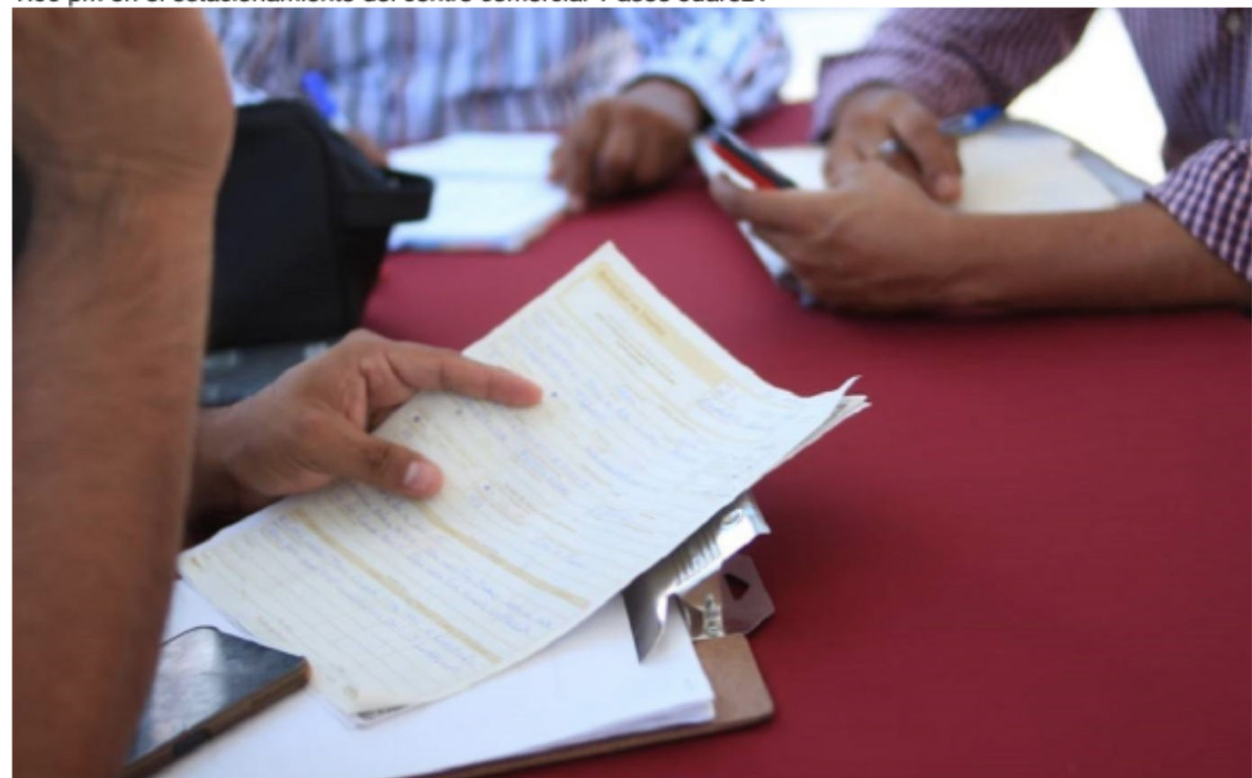
La Macro Feria del Empleo de Juárez ofrecerá vacantes como almacenistas, ayudante general, calidad, limpieza, entre otros.

El Gobierno de Juárez llevará a cabo el próximo lunes 13 de marzo la Macro Feria del Empleo de 10:00 am a 1:00 pm en el estacionamiento del centro comercial 'Paseo Juárez'.